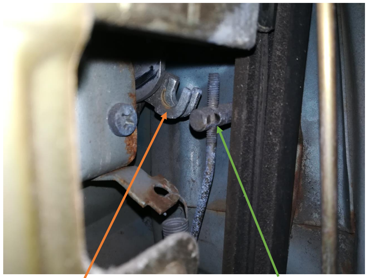
(Aggancio della maniglia)